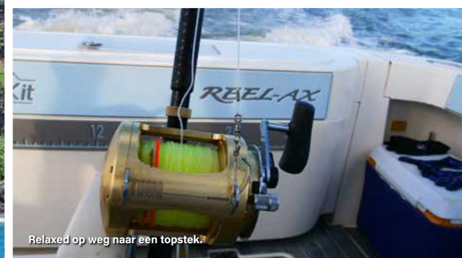
Relaxed op weg naar een topstek.

Naast het kant- en inshore vissen kan je hier vanzelfsprekend ook offshore vissen. Daarbij heb je twee verschillende opties, te weten; medium offshore en de long range offshore. De medium versie is 15 tot 25 mijl buitengaats op dieptes tot 100 meter. Hier vind je zeilvis, jack crevelle, mahi mahi, bonito, skipjack etc. laten we zeggen de wat kleinere soorten. Bij de long range visserij – rondom de drop-off - krijg je te maken met marlijn (zwart, blauw en gestreept