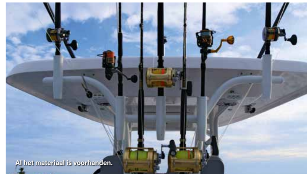
Al het materiaal is voorhanden.

Aangezien de kosten voor het meenemen van een hengelkoker nogal hoog zijn (zo'n €180,-), is mijn advies om alleen maar reishengels mee te nemen. Uiteraard moeten alle molens zeewaterbestendig zijn. Verder hebben we wat poppers van 10 tot 18 cm en tot 150 gram meegenomen (om echt ver te kunnen gooien). En ook wat diepduikende zoutwaterpluggen en jerkbaits van 8 tot 15 cm (met doorgeluste ogen, anders worden je jerkbaits uit elkaar getrokken) en wat snelzinkende lepels van 40 tot 80 gram. Al het kunstaas moet zijn voorzien van 3x strong dikke, vlijmscherpe haken (dregmaat vanaf 1/0 of vergelijkbare grote enkele haken), gemonteerd aan passende sterke splitringen. Verder zijn een lipgripper, handschoenen en een tang handig bij landen en onthaken van een vis in de kajak. En niet te vergeten: goede bescherming tegen de zon; pet, buff,