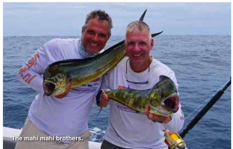
The mahi mahi brothers.

we de vissen al genoemd die we gevangen hebben? Kortom dit artikel is te kort om alles goed te kunnen beschrijven. ■