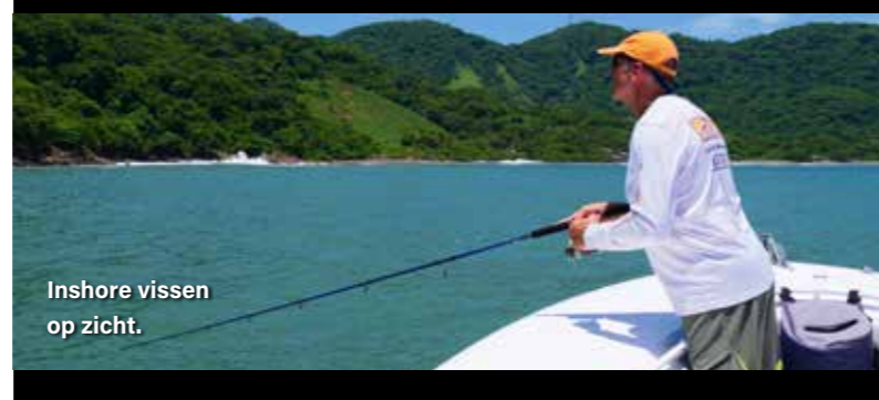
Inshore vissen op zicht.