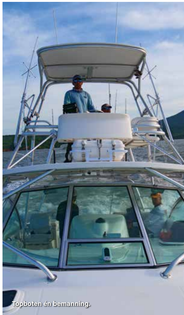
Topboten én bemanning.