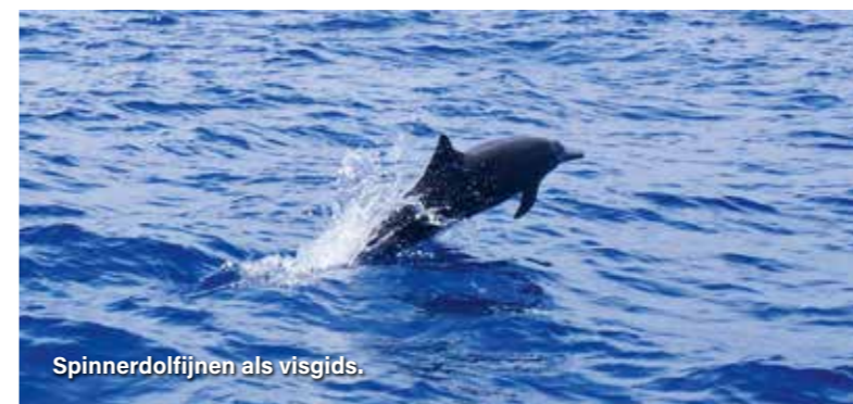
Spinnerdolfijnen als visgids.