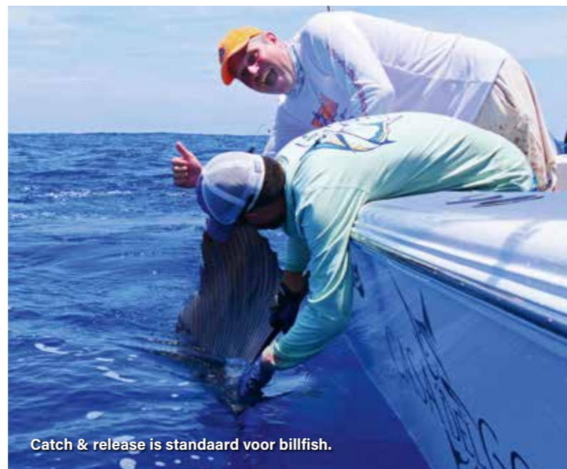
Catch & release is standaard voor billfish.

Bij het offshore trollen ben je doorlopend op zoek naar scholen met spinnerdolfijnen. Daar zwemmen namelijk bijna altijd tonijnen bij in de buurt en als er dan een feeding-frenzy ontstaat kan je je popperhengel uit de steun pakken. Dit moet dan wel een 'echte' popperhengel zijn met bijbehorende molen, lijn en grote poppers van 15 cm+ en 120 gram en meer, want als je dan een tonijn van