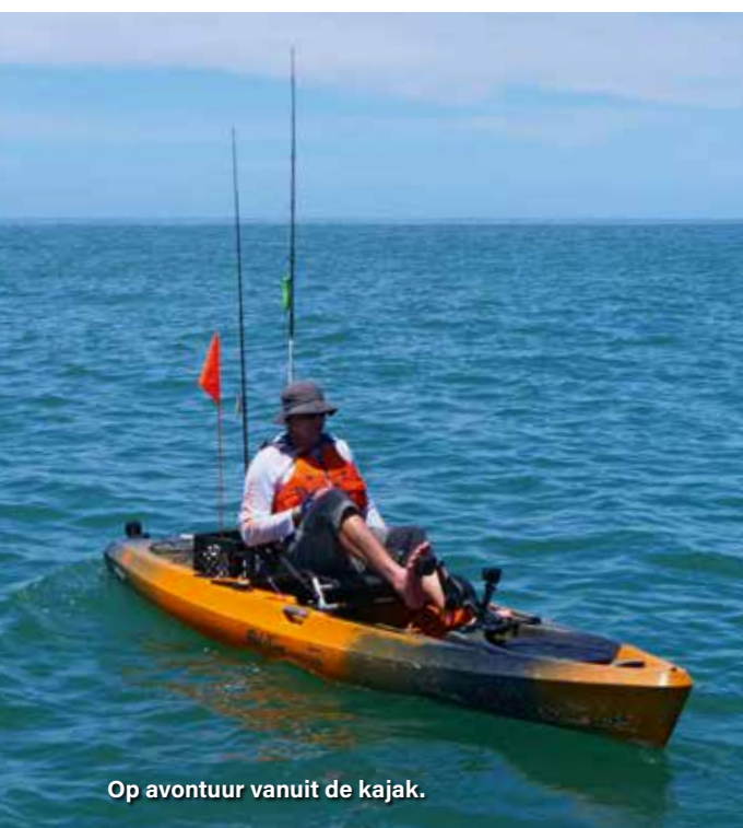
Op avontuur vanuit de kajak.