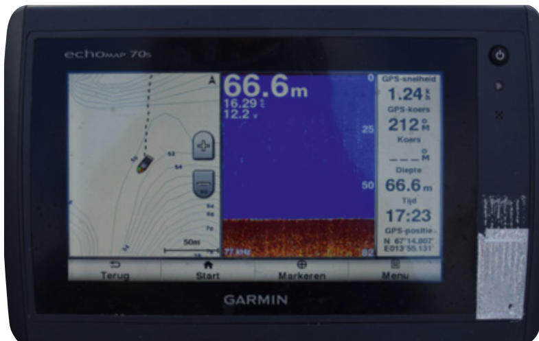
Waar zitten ze toch, die verdraaide heilbotten