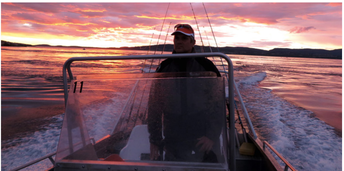
De zee leek wel van vloeibaar goud!