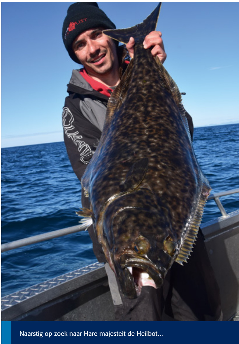
Naarstig op zoek naar Hare majesteit de Heilbot...

Maar goed, terug naar de betreffende avond. Ik laat mijn shad zakken. Er staat geen stroming en het is windstil, zodat ik perfecte controle heb over mijn kunstaas. Nadat ik de bodem heb geraakt, draai ik rustig een meter of 15 op. Op het ogenblik dat ik een ‘spinstop’ doe – zoals het even ophouden met draaien genoemd wordt tegenwoordig – krijg ik een enorme dreun op mijn hengeltop. Bij heilbotten heb je na de aanslag meestal een kort momentje waarop je gewoon vast lijkt te hangen. Een beetje zoals je dat ook hebt bij grote snoeken, en dan pas barst de hel