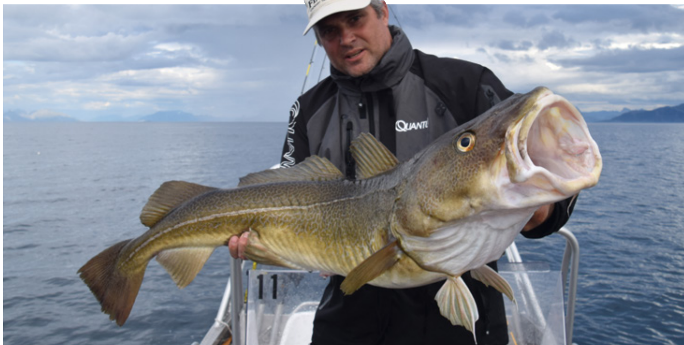
Heilbot of niet; met dergelijke vissen kun je alleen maar dankbaar zijn...