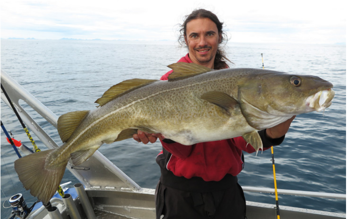
Deze kabeljauw had wel oog voor een flankende shad.