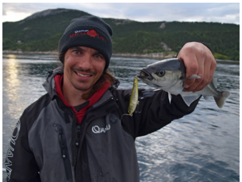
Met oppervlaktekunstaas op coalies.

Ik sta te springen in de boot: wát een heerlijke bezigheid! Ik vang zelfs een hele mooie makreel, een minitonijn-