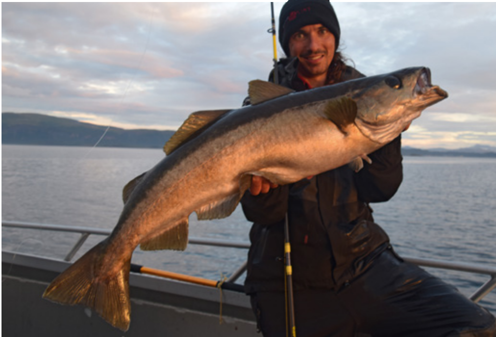
Deze pollak van ver boven de 90 cm deed de schellen van mijn ogen vallen...

los. Dat is nu echter niet het geval. Aanslaan is onmogelijk, want de vis gaat er echt in een fractie van een seconde als een speer vandoor. De snelheid waarmee de lijn van mijn spoel gutst, is onvoorstelbaar. Wat heb ik in 's hemelsnaam gehaakt? Een heilbot-op-speed? Of eentje die in zijn staart is gehaakt? Een zeehond? Na vele minuten drillen, komt mijn tegenstander eindelijk in zicht. Een rondvis. Een rondvis verdorie. Welke rondvis is er in 's hemelsnaam in staat om zoveel verzet te plegen? Lars is de eerste die het door heeft: "een pollak!" roept hij. "Maar wat voor één!"