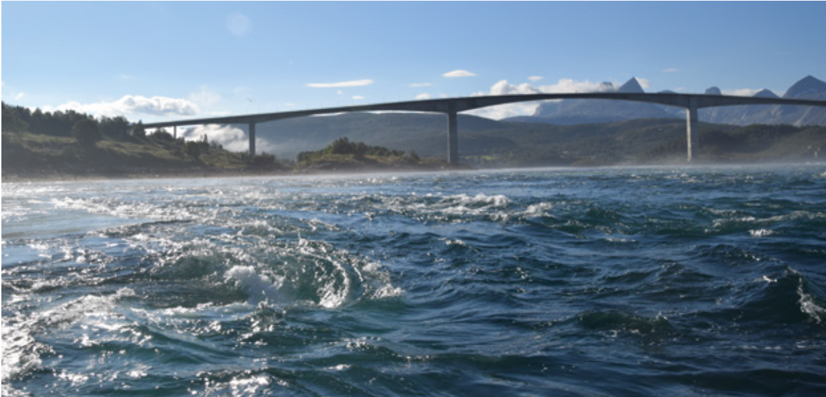
Het hardst stromende stuk zeewater ter wereld: Saltstraumen, in Noorwegen.