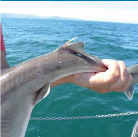
Daar zijn de spurdogs! Ze hebben prachtige oogjes, maar let op de stekels...