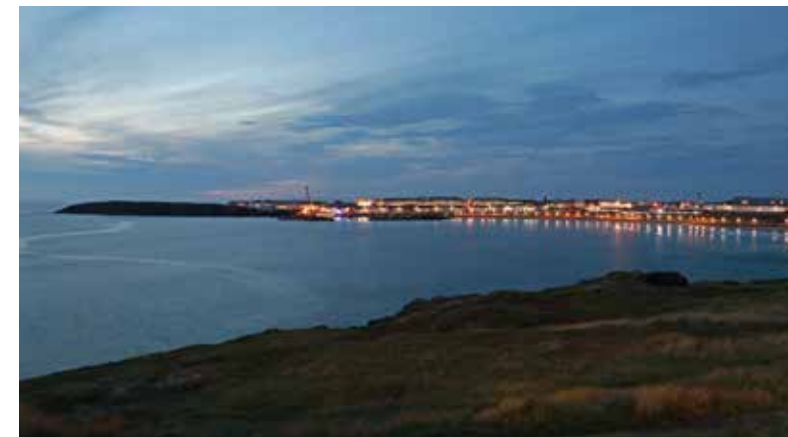
Wanneer Noord-Ieren dromen, dan dromen ze van een (tweede) huis met zeezicht in Portrush of het naastgelegen Portstewart.

legen Portstewart; een droomwens die met name uitkomt voor de pensionado's en zij die niet op een penny hoeven te kijken.