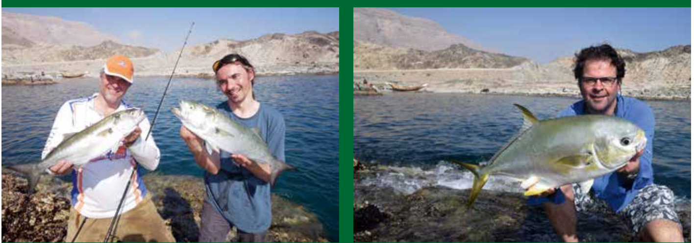
Links: We hadden het spelletje door... Rechts: Eén van de meeste geperde sportvissen ter wereld, de permit