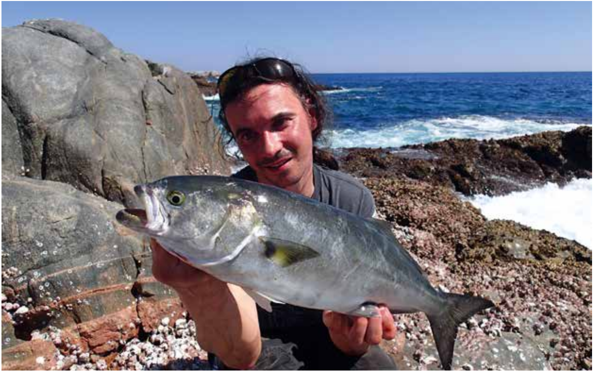
Blij met mijn eerste bluefish!

D it boek handelt over een sultan die de nare gewoonte heeft om elke avond een andere bedpartner te kiezen en die dan de volgende ochtend een kopje kleiner te maken. Eén meisje is hem echter te slim af: zij laat haar verhaal steevast eindigen met een cliffhanger, zodat de sultan haar telkens spaart uit nieuwsgierig-