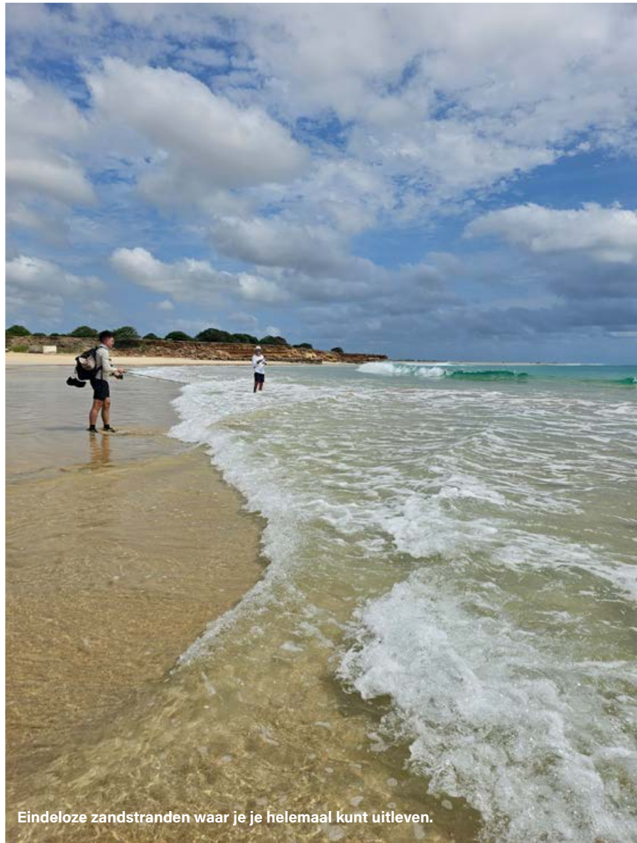
Eindeloze zandstranden waar je helemaal kunt uitleven.

De grote hengels gaan regelmatig krom. Het zijn vooral verpleegsterhaaien die we vangen, afgewisseld met citroenhaaien en zwartpuntahaaien. Vooral de verpleegsterhaaien zijn echt groot. De meeste gaan vlot door de 2-meter grens, de grootste van de trip mat zelfs 230 cm. De bonusvis op deze hengels is voor mij. Na het inwerpen zet ik de hengel terug in de steun en draai de lijn iets strakker zodat de lijn niet tussen de rotsen voor de kant vast kan raken. Nog voor ik terug aan kan sluiten bij de barbecue die Sam voor ons heeft verzorgd, krijg ik wat