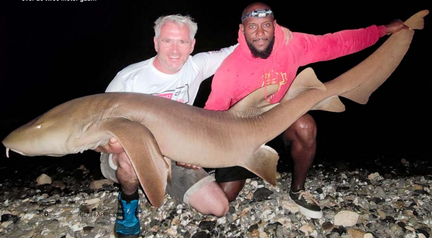
Verpleegsterhaaien die vlotjes over de twee meter gaan!