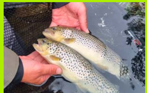
Het stuwmeer bleek vol met (uitgezette) forel te zitten.