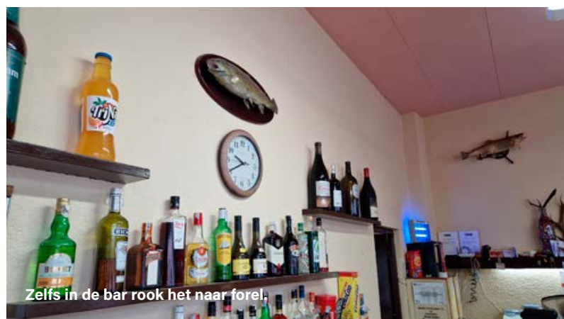
Zelfs in de bar rook het naar forel.

Dit euronymphing is een vorm van vissen die je nog het beste kunt vergelijken met verticalen op snoekbaars: je laat een op een tungstenkopje gebonden imitatie van een larve de contouren van de bodem volgen. Om dat goed te doen, heb je een hengel nodig van 10 of zelfs 11