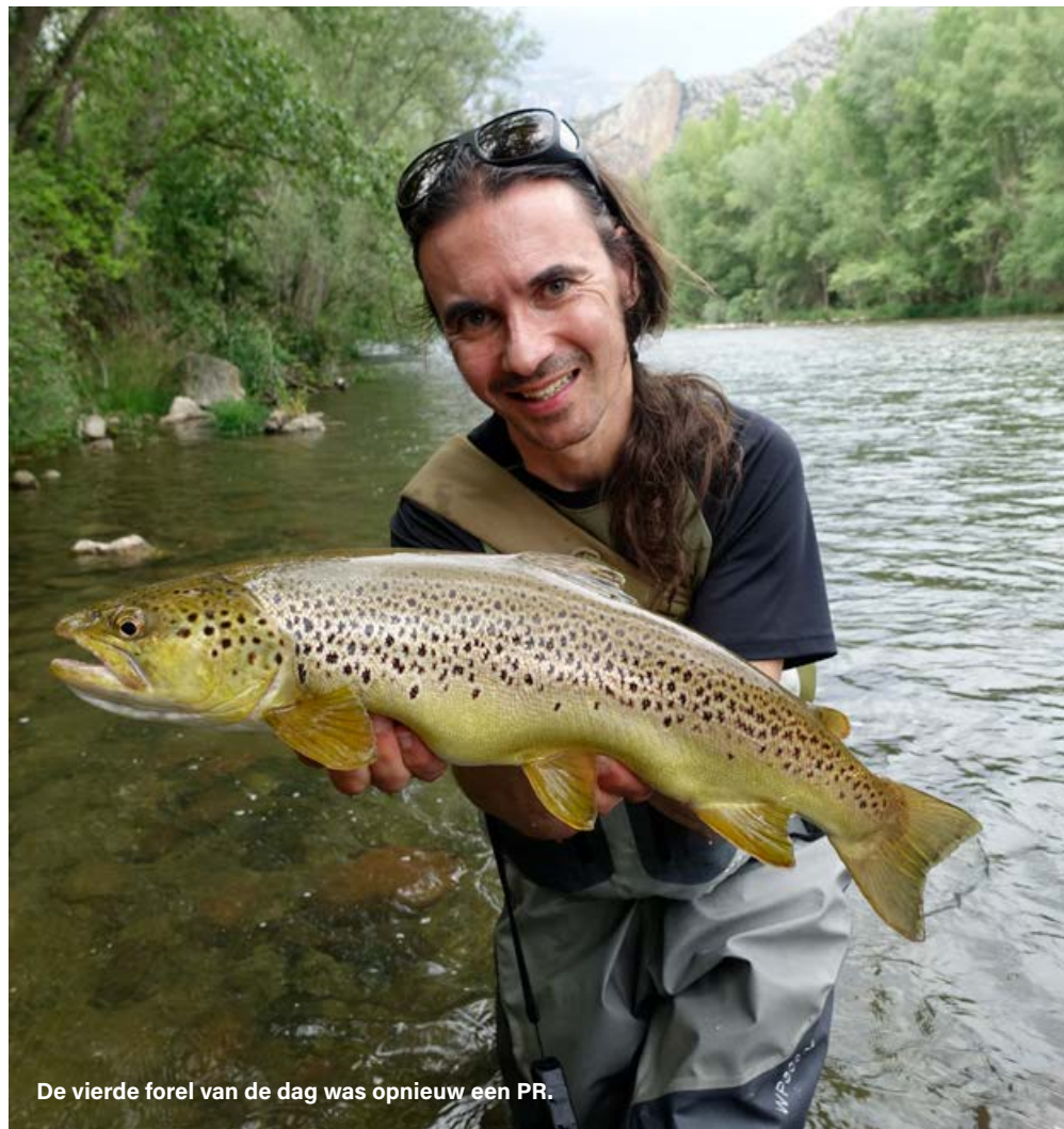
De vierde forel van de dag was opnieuw een PR.

De volgende dag gingen we natuurlijk meteen terug naar de won-