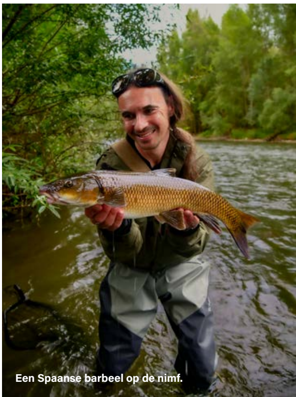
Een Spaanse barbeel op de nimf.

voet, in de gewichtsklasse 3 of 2. Hij moet gevoelig zijn in de top zodat je bodemcontact kunt houden, en parabolisch genoeg om je toe te laten met zeer dunne onderlijnen te vissen. Ik had niet de juiste hengel bij me hiervoor, en mijn kennis van de techniek beperkte zich tot het ooit eens bekeken hebben van een paar youtubefilmpjes, maar na al die uren zonder actie besloot ik het zo goed en zo kwaad als het ging te imiteren met wat ik bij me had. When in Rome, act like the pope zeggen de Engelsen altijd, en nadat de local was opgekrast ging ik op de plek staan die hij had verlaten. Ik begreep meteen waarom hij daar had postgevat: net na een ondiepe stroomversnelling, precies op het punt waar het water weer dieper werd. Dikke nimf eraan, arm gestrekt om zo ver mogelijk te komen en hop, vissen maar. Na vijf minuten kreeg ik kramp in mijn arm en besloot ik dat vissen niet voor niets vinnen hadden en dus ook wel de moeite konden nemen om vlak voor mijn voeten te komen azen. Nog vijf minuten later liep mijn nimf vast aan een steen op de bodem, met lijnbreuk tot gevolg. Het duurde nog eens vijf minuten voor ik klaar was met vloeken en de boel opnieuw gemonteerd had met een iets lichtere nimf.