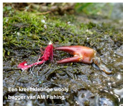
Een kreeftkleurige wooly bugger van AM Fishing.