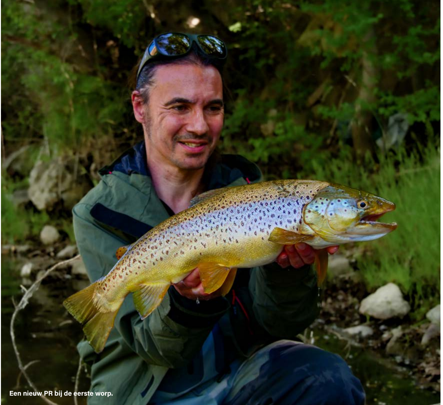
Een nieuw PR bij de eerste worp.

een vliegtuig en een huurauto aan te pas –, maar dan sta je eindelijk toch op de oevers van het water dat jou al zo lang riep. Er komt een waas voor je ogen, haastig tuig je je hengel op. Natuurlijk vergeet je de lijn dan door een van de oogjes te voeren, en met nerveus trillende vingers een onderlijn door een minuscuul haakoogje krijgen valt ook niet echt mee. Maar uiteindelijk lukt het me en kijk ik met een hengel in de hand vanop een grote rots, over de bovenloop van de Segre-rivier uit. Een grote forel laat zich even zien, vlak voor de metershoge steen waarop ik sta, alsof hij me wil verwelkomen. Ik wacht even op mijn vismaat Joris, maar die is aan het bellen met een klant en het ziet ernaar uit dat dat nog wel even kan duren. Ik laat me voorzichtig zakken tot ik bij het water kan en werp mijn streamertje – een rode