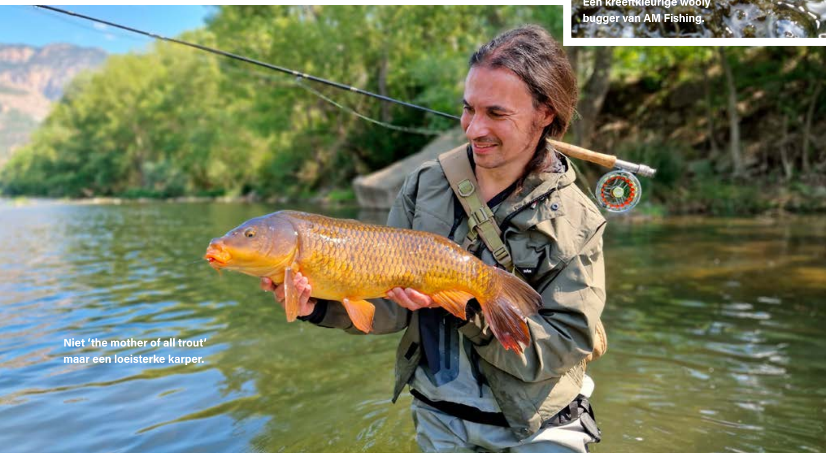
Niet 'the mother of all trout' maar een loeisterke karper.