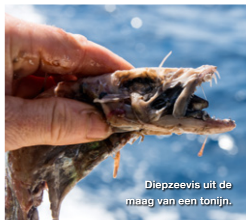
Diepzeervis uit de maag van een tonijn.

Er zijn geen meeuwen, visdiefjes, jan van genten, albatrossen of andere visetende vogels die je de weg wijzen. Af en toe zie je vliegende vissen voorbij zweven en één keer zagen we er een paar duizend opstijgen, opgejaagd door roofvis. Maar deze signalen zijn te schaars om je visserij op af te stemmen en gelukkig ook niet echt nodig. Die zwerm vliegende vissen staat wel voor altijd op ons netvlies. Op de zuidbank aangekomen zien we twee lokale beroepsvisbootjes die met 'de vaste stok' op tonijn vissen.