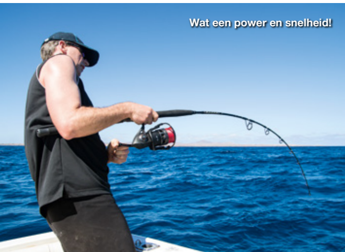
Wat een power en snelheid!