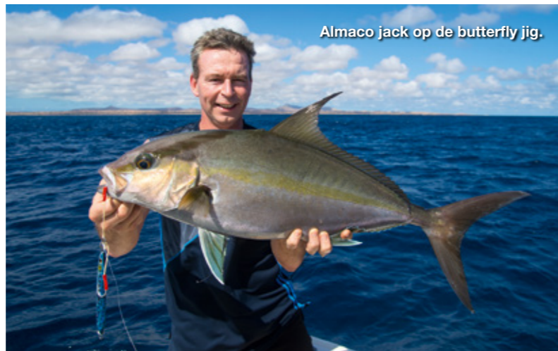
Almaco jack op de butterfly jig.

staan we beiden vol goede moed een speedjig omhoog te sjoeren. Geïnspireerd door verhalen van Mike en Nuno over enorme groupers en jacks vinden we zelf dat we de slag en het ritme best snel te pakken hebben. Een kleine 10 minuten later zakt het lood ons echter al in de schoenen; we trekken de conclusie dat speedjiggen alleen is weggelegd voor van die grote opgepompte gasten uit de sportschool. Dan volgt uit het niets een aanbeet. Een minuut of 10 later hebben we beiden een almaco jack langs de boot gedirigeerd. Wat een brute power, wat een snelheid. Speedjiggen werkt dus, maar vermoeiend is het wel. Het is de kunst