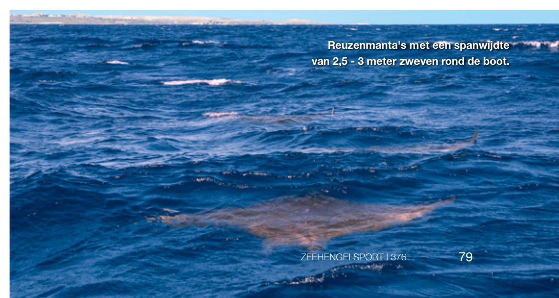
Reuzenmanta's met een spanwijdte van 2,5 - 3 meter zweven rond de boot.

mogelijk om vrijwel elke vissoort te triggeren om tot de aanval over te gaan. Zeker als je de techniek nog niet in de puntjes beheerst, doe je er goed aan met lichtere speedjigs (100-165 gram) te vissen. Het is gemakkelijker er een goed ritme in te houden en je houdt het een stuk langer vol. Tegen het einde van de visdag blijkt dat we met nog lichtere pilkertjes ook leuke resultaten kunnen boeken. Terwijl Nuno de boot feilloos boven de juiste taluds stuurt, laten wij aan