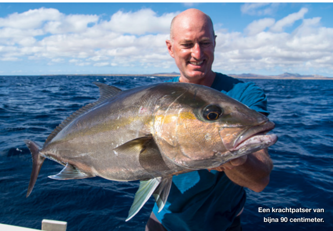
Een krachtpatser van bijna 90 centimeter.