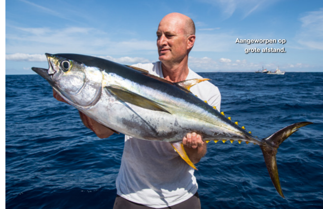
Aangeworpen op grote afstand.

licht materiaal twee pilkertjes van 60 gram naar beneden dwarrelen. Wat huppelende bewegingen boven de rotsachtige bodem leveren in een half uur een half zeeaquarium vol aan schitterende vissen op.