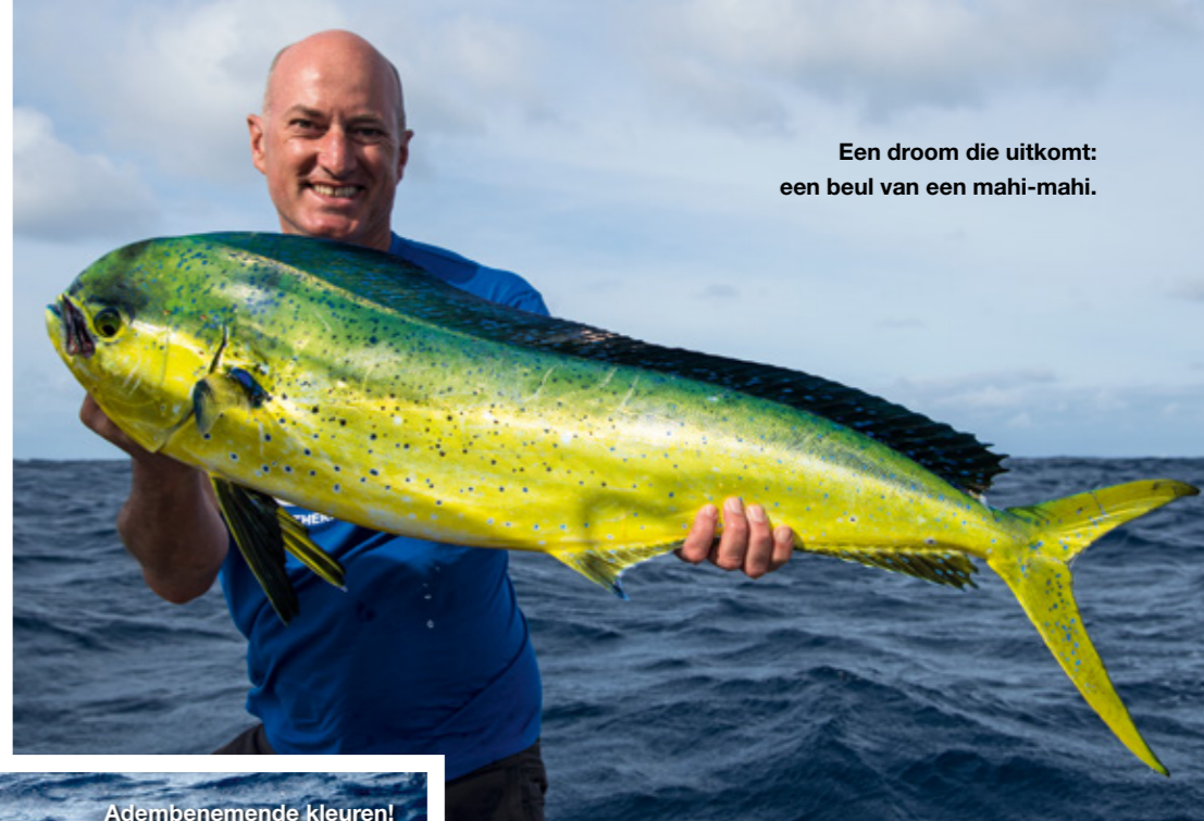
Een droom die uitkomt: een beul van een mahi-mahi.

Tijdens deze trip lijkt alles te lukken. En het wordt alleen maar beter. Het is onze allerlaatste dag op het water en we missen nog één vis waar we allebei al heel lang op hopen: een beul van een mahi-mahi.