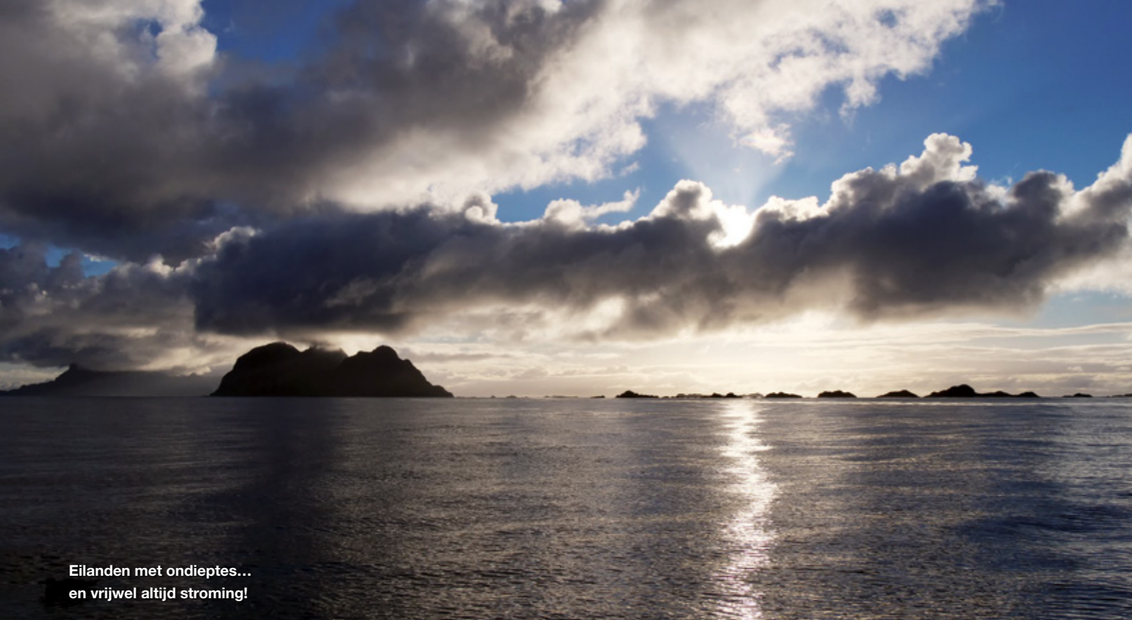
Eilanden met ondieptes... en vrijwel altijd stroming!

Na een korte instructie over de boot van de lokale gids Kato, varen we de haven uit in zuidelijke richting. Pal voor de monding van de haven liggen de eerste rotsen en we vangen binnen vijf minuten 15 koolvissen en 10