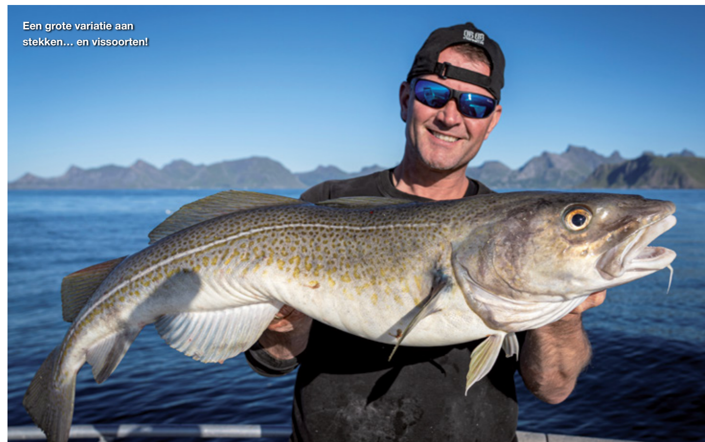
Een grote variatie aan stekken... en vissoorten!

stroming zoveel toe dat vissen onmogelijk is geworden. 500 gram haalt de bodem niet en we driften meer dan 8 km per uur. We verkassen daarom meer naar de rand van de harde stroming. Ongelooflijk, slechts 500 meter