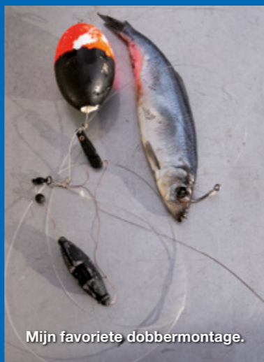
Mijn favoriete dobbermontage.

Ik vis met de dobber op heilbot op dieptes tot zo'n 30 meter. Ik gebruik daarvoor een circle hook 2/0 aan een fluorcarbon onderlijn van 120 cm lang en 1 mm dik die ik met een tonwartel aan de hoofdlijn bevestig. Op de hoofdlijn zet ik een rubberkraal en daarboven een loodje van 250 gram en daarboven een meervaldobber met 250 – 300 gram draagkracht. De dobber is met een speldwartel geborgd op de hoofdlijn en wordt op de gewenste diepte, na het laten zakken van het lood vastgezet met een speciaal clip die de dobber op de hoofdlijn vastklemt. Met een circle hook mag je nooit aanslaan; als de vis het aas pakt tel je tot 3 en draai je de lijn langzaam strak totdat je gewicht voelt. Dan zit de haak in de mondhoek van de heilbot.