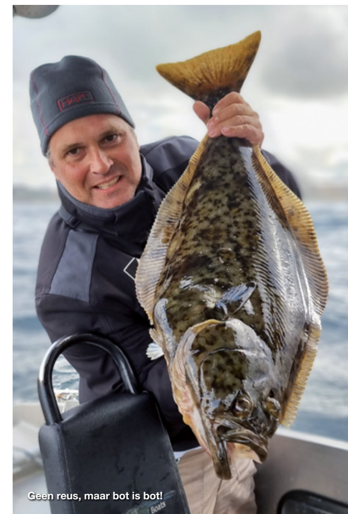
Geen reus, maar bot is bot!