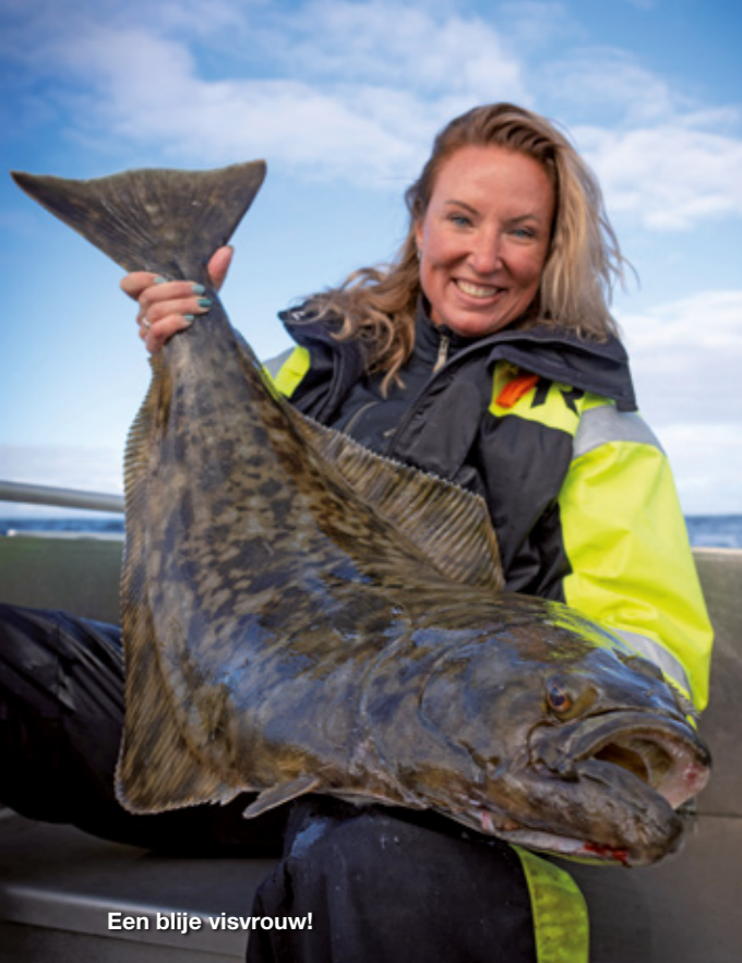
Een blije visvrouw!