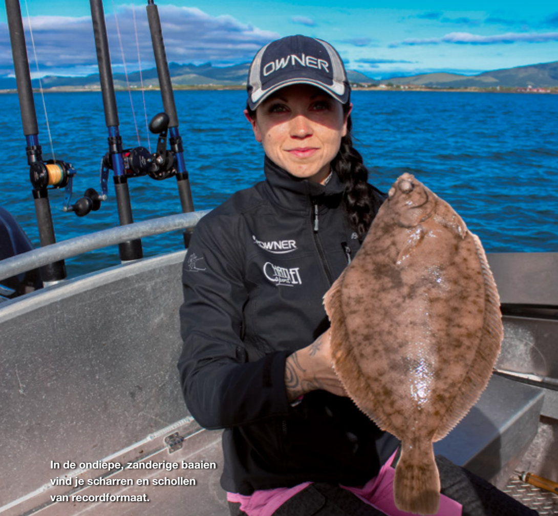
In de ondiepe, zanderige baaien vind je scharren en schollen van recordformaat.

tes op 30 minuten zuidoostelijk van de haven van Ballstad. Hier rond omheen wordt aan het einde van het voorjaar kabeljauw gevangen die na