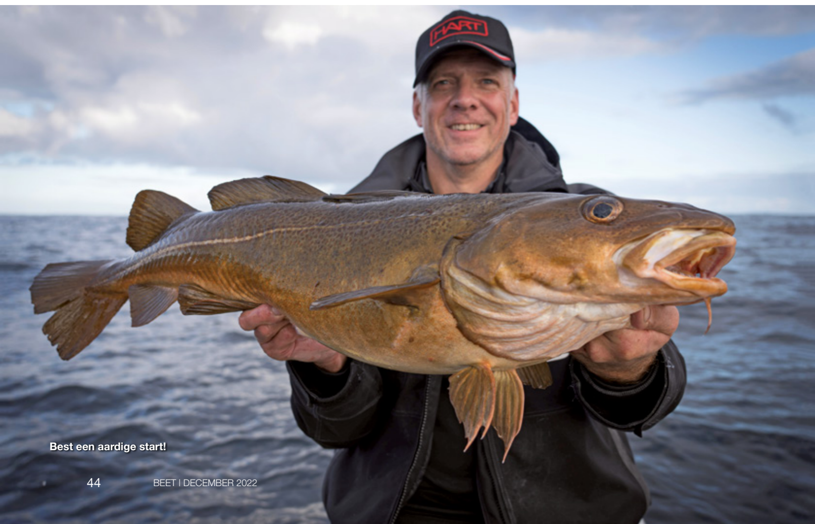
Best een aardige start!

van de stroming en de wind, om gericht op heilbot te vissen op dieptes van 15 tot 30 meter. Ideaal om een dobber met aasvis uit te zetten. Na een paar minuten zien we op de dieptemeter een 'stijger'. Een heilbot