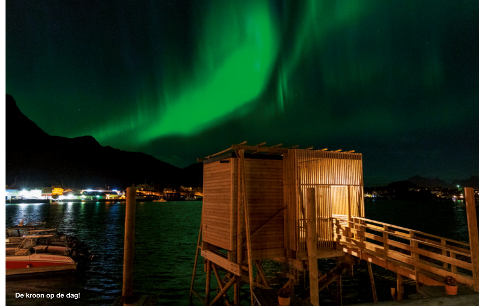
De kroon op de dag!

verder dan onze vorige stek, stroomt het nog steeds behoorlijk, maar is het water weer nagenoeg vlak.