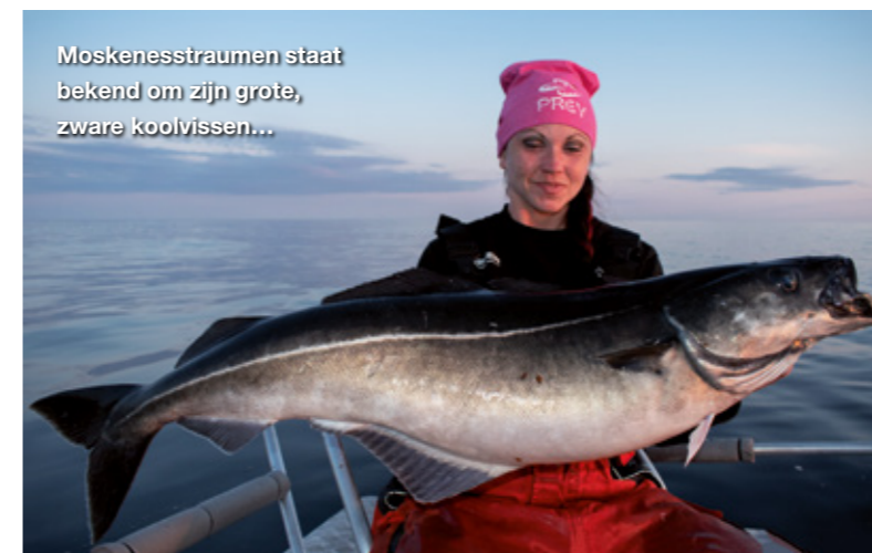
Moskenesstraumen staat bekend om zijn grote, zware koolvissen...

die van de bodem af komt, de shad van Joris volgt en zich weer laat zakken. Ze zijn er dus wel, maar helaas hebben de heilbotten er nog geen zin in. Daarna varen we verder in noordelijke richting. De Nappstraumen mondt daar uit op een plateau van enkele kilometers dat zo'n 30 meter diep is. Langs de oevers zijn veel zones met ondiepere stukken waar de stroming behoorlijk overheen loopt. Ideale heilbotstekken dus.