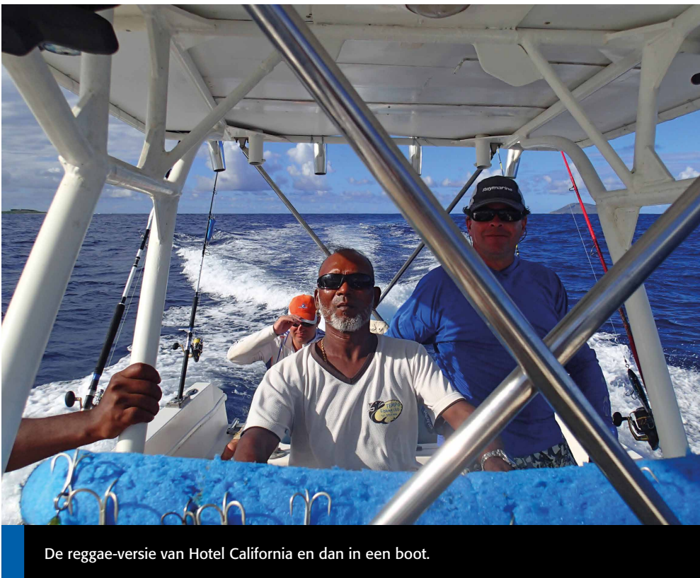
De reggae-versie van Hotel California en dan in een boot.