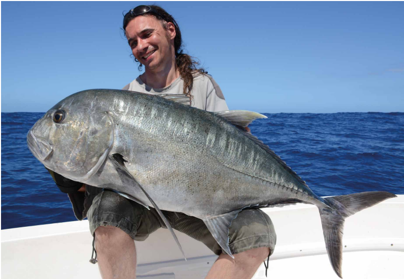
De eerste GT van de trip.

ken waar het minder hard stroomt. Deze vanuit Japan overgewaarde techniek is immers aanzienlijk minder belastend voor je lichaam. Het komt erop neer dat je kleine, brede jigs van 80-150 gram in de onderste waterlagen laat dansen met kleine sprongen. Concreet vis je in het onderste derde van de waterkolom: je laat je jig op de bodem vallen en geeft meteen een tik – dat is cruciaal want anders loop je snel vast. Daarna draai je heel traag op terwijl je snelle maar korte tikken geeft – het is geen wiskunde natuurlijk maar vijf tot acht tikjes per omwenteling van de molen should do the trick. Een keer je een aantal meter hebt opgedraaid, laat je je jig weer vallen. Opmerkelijk is dat je zo plots heel andere vissoorten begint te vangen: in Mauritius diverse oogverblindend mooie snapper- en grouperachtige soorten, die trager zijn en veelal dichter bij de bodem jagen. Je kunt vaak ook met lichtere hengels aan de slag omdat die vissen meestal niet van het formaat XXL zijn.