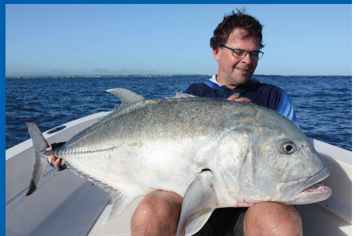
Drillen op het scherpst van de snee, het resultaat is een dikke Caranx ignobilis...