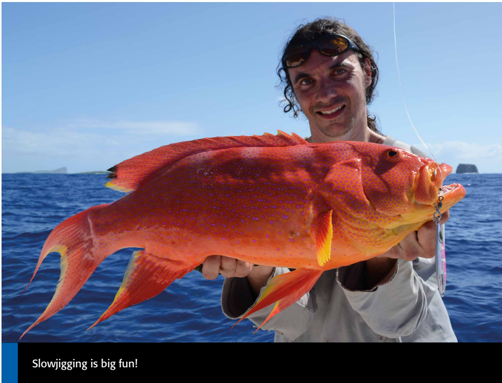
Slowjigging is big fun!