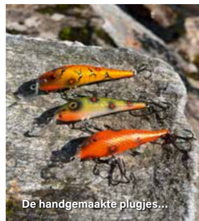
De handgemaakte plugjes...

Als ik kijk naar de technieken waarmee op zalm gevestigd wordt dan kon ik er drie vaststellen. Uiteraard het vliegvisseren met zwaardere materiaal waarbij de visser vanaf de oever de zalm probeert te haken. Daarnaast wordt er vanaf de kant op zalm gevestigd met wormen. Een techniek waarbij een wapperlijn met een haak met wormen, verzaaid met lood, in de rivier wordt geworpen die vervolgens meestuurt in de stroming. En als derde techniek, het vissen vanuit boten waarbij de visser klein kunstaas, meestal plugjes, achter de boot vist en de gids rustig roeit en de hotspots in de rivier opzoekt met de boot. Deze techniek wordt ook wel 'harling' genoemd.