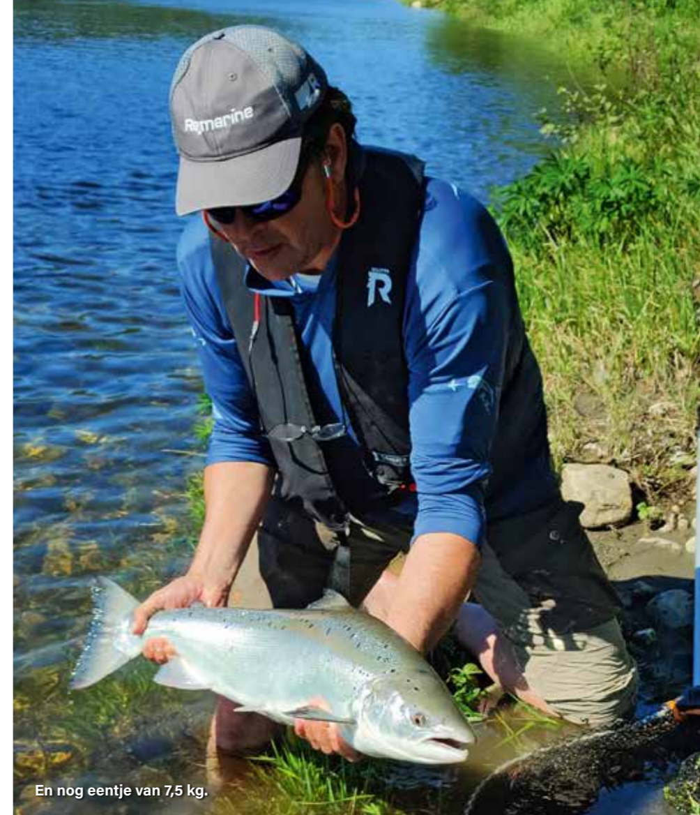
En nog eentje van 7,5 kg.

Tussen de sessies door relaxen we wat, praten over vissen en werk, eten heerlijke maaltijden, drinken een lekker glas wijn en maken we een uitgebreide trip en wandeling langs de rivier richting een van de dammen. Dat maakt deze visserij wel echt heel gaaf. Anders leert mij ook nog het vliegvisserij met de tweehandige rolworp, een techniek die ik nog nooit beoefend had. Ik ben onder de indruk van zijn behendigheid en precisie. Zelf lukt het me na een paar uur om de lijn eruit te krijgen, maar dat is dan het ook wel. Staand in mijn waadpak in de rivier kan ik me wel voorstellen dat als je dit goed beheerst het echt heel mooi is om zo met de natuur verweven te raken. Wie weet, misschien dat ik er ooit nog eens aan begin. Wat ook altijd bijzonder is, is het feit dat het 's nachts in juni hier niet meer donker wordt. Je kunt dus vissen wanneer je wilt! Noorwegen is echt prachtig en dit gebied helemaal. En je kunt je naast het vissen ook prima op andere wijze in de natuur vermaken.