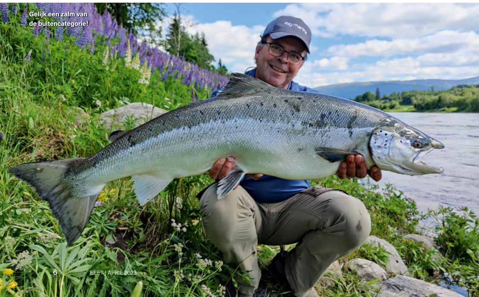
Gelijk een zalm van de buitencategorie!

'gegrepen'. En ik kan me voorstellen dat na het lezen van dit verhaal en het zien van de foto's je begrijpt waarom dit is. De moeite waard om zelf ook eens te overwegen! Neem dan gerust contact met me op als je meer informatie wilt. ■