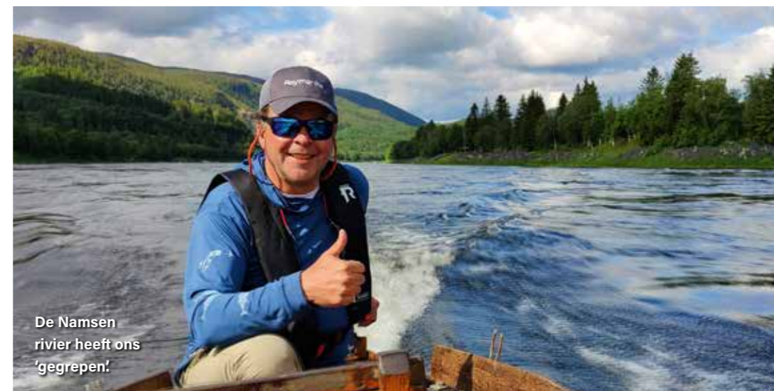
De Namsen rivier heeft ons 'gegrepen'!