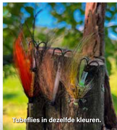
Tubeflies in dezelfde kleuren.

We vliegen via Trondheim en na een prachtige autoreis van ongeveer 2,5 uur richting Vaerem Gard in de buurt van Grong zetten we onze spullen in het prachtige huis en genieten we van het uitzicht op de rivier, het mooie achterland en vooral het schitterende weer! Het is juni, alles staat in bloei, de lucht is blauw en de rivier stroomt aan onze voeten voorbij. Het water staat hoog; de dagen ervoor is er hogerop nog veel sneeuw gevallen