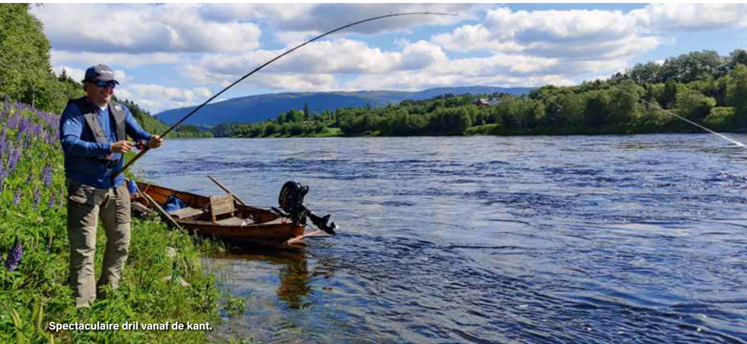
Spectaculaire drill vanaf de kant.

overgang naar zoetwater niet echt meer eet. De aanbeten komen dan ook voort uit agressie, je moet ze verrassen en prikkelen. Het samenspel met de gids is dus echt belangrijk en ook het slim opzoeken van de hotspots met de boot waarmee het kunstaas de zalm opeens verrast en een aanbeet triggert.