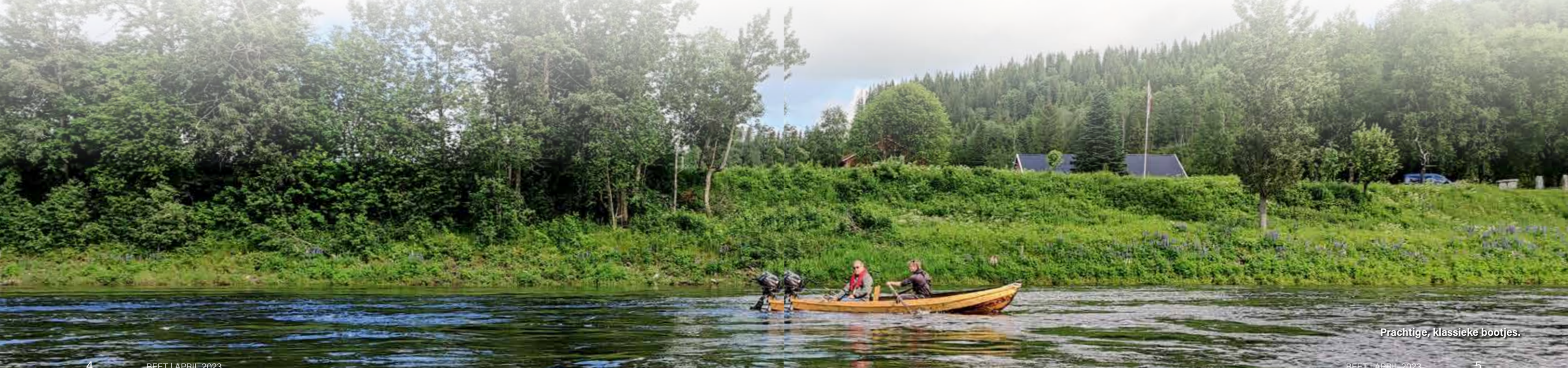
Prachtige, klassieke bootjes.

achter grote stenen, langs de oevers waar het diep is en aan de randen van stroomversnellingen. Daar wil je vissen en op die plekken kun je ook met de hand wat meer of minder actie in het kunstaas brengen. Wat ook interessant is, is dat de zalm die hier nu zwemt terug gekomen is uit de zee en in principe door de