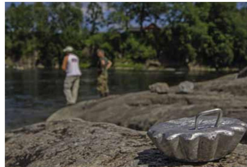
De loden cupcake voor het statisch vissen.

De uitstraling van de visstekken of 'beats' in zalmjargon, is rond Holmfoss heel wat anders dan op traditi-onele zalmrivieren waar doorgaans alleen met de vlieghengel wordt gevestigd. Het kan er druk zijn. Op de oever waar de rivier door een nauw kanaal wordt geduwd, zijn hengels-teunen geplaatst. Hier mogen per dag vijf vissers hun geluk beproe-ven. Holmfoss 1 staat bekend als een lastige, maar ook zeer productieve stek. Niet gek, want iedere zalm en zeeforel die vanaf zee de paaiplaats wil bereiken moet door één van twee nauwe doorgangen tegen de stroomversnelling opzwellen. Holmfoss 2 is de brede pool waar de stroomversnelling in uitloopt. Deze bevis je het beste vanuit een bootje. En dat is goed te merken. Op stevig stromende stukken liggen de vis-sers bootje aan bootje. Het lijkt hen niet te deren. Nieuwkomers worden enthousiast begroet en naar een ide-ale ankerplek geloodst. Waar op veel plekken veel vissers dichtbij elkaar tot irritaties en ruzie leidt, lijkt hier juist een 'hoe meer zielen, hoe meer vreugd'-stemming te heer-sen. Maar wel met een beperking, legt Nils uit. Er wordt dagelijks per stek een beperkt aantal dagkaarten uitgeschreven. En ook de vangst is beperkt door een strikte en strak gehandhaafde bag-limit.