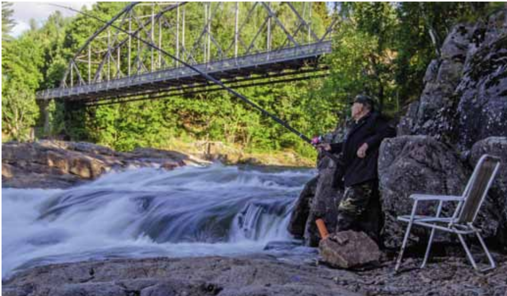
Een bijzondere visserij aan zo'n snelstromende rivier.