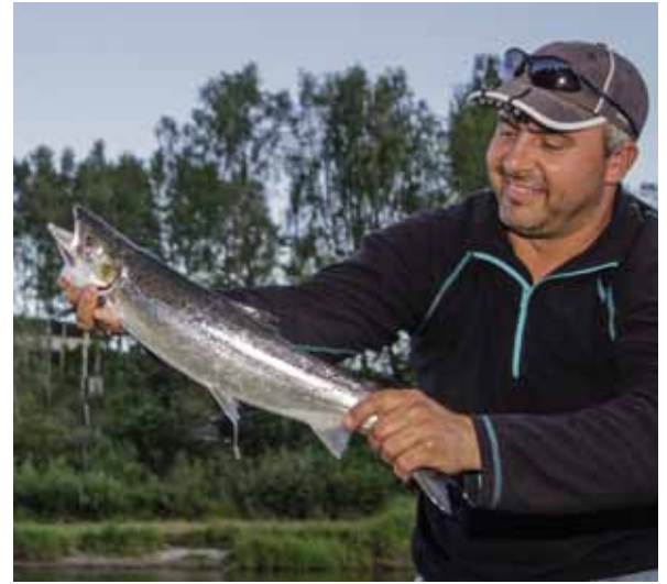
Een vis drillen in deze klotsbak is geen sinecure.