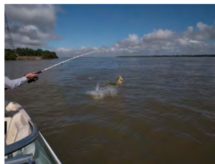
De Paraná is een serieuze rivier.

aarzelde ik dan ook geen seconde. Mijn spaarvarken kreeg spontaan een hartverzakking, maar moest er toch aan geloven. Río Paraná, Paraná-rivier: here we come!