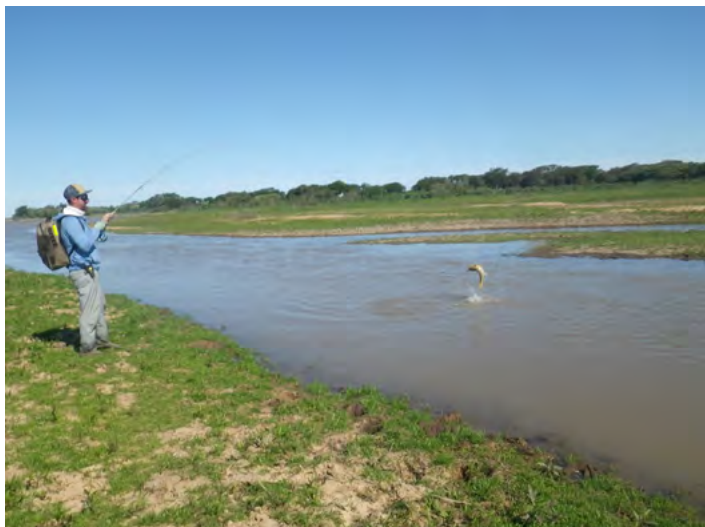
Kantvissen in de vele kreken was het allerleukste.