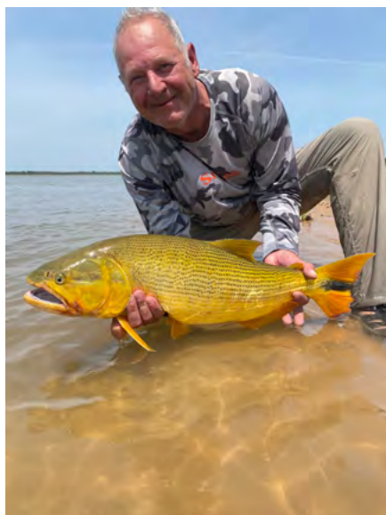
Mooier dan dit kan een vis toch niet worden!

in zo’n peperduur hotel te gaan zitten. Maar ik droomde er wel al heel lang van om een keer zo’n gouden dorado aan de vlijmscherpe tandjes te voelen, en toen de kans zich voordeed om mee te gaan met Joris van Visreis.nl naar Argentinië,