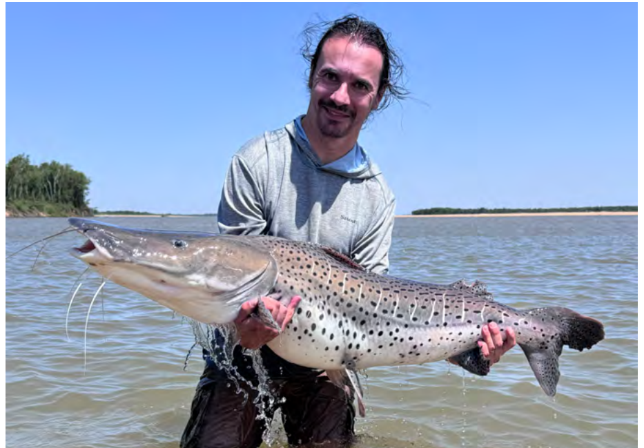
Surubi's zijn bizar sterke tegenstanders.

De tweede visserij die we beoefenden, was zoals gezegd vanaf de oever. Beter gezegd: we werden afgezet op een zandbank en konden dan wadend vissen in de baaien daarrond. Dat deden we zowel met jerkbaits (Salmo Sliders van 10 cm waren top) als met streamers, aan een #7 vliegenlat. Het grappige was dat je vaak al aan het wateroppervlak kon zien of er jagende dorado's aan het werk waren in de baai. Die vinden het namelijk amusant om woest om zich heen te happen als ze door een school aasvis razen. Doordat die aasvissen een hoog oliegehalte in hun lijf hebben, wordt er een olieachtige vlek zichtbaar aan het oppervlakte... De streek waar we visten, was die van het estuarium van de Paraná. Via allerhande kleinere en grotere aftakkingen, kon je zeer ver van de bewoonde wereld komen, in een ontzettend mooi landschap. Dat vond ik persoonlijk het allermooiste om te doen: wadend in kniediep water, op tientallen kilometers van de dichtstbijzijnde weg, het labyrint van krekens en baaien uitkammen met de vlieghengel. Als je dorado's vond, dan was het steevast raak, en niet zo'n klein beetje/ Vis na vis stortte zich dan op mijn streamers. Op mijn beste dag schat ik dat ik misschien wel 150 aanbeten heb gehad. Heel groot waren die vissen niet – zo tussen de 2 en de 4 kilogram schat ik – en ik verspeelde