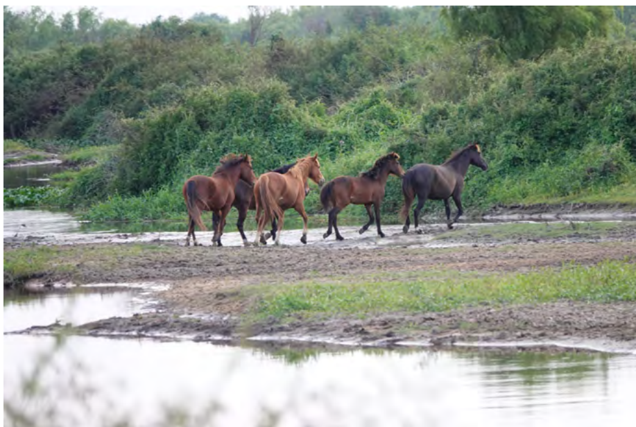
Een prachtig landschap, zonder mensen...