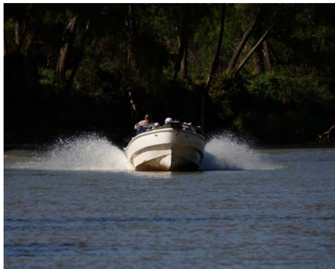
Op weg naar het avontuur.

De zandbanken en bomen die ik noemde zijn perfect voor dit werk, want dit soort obstakels breken de hoofdstroom en creëren keerstromen, draaikolken, diepteverschillen en luwe plekken. De vistechiek was daar dan ook op toegespitst. Concreet kwam het erop neer dat de gids de boot stil hield stroomopwaarts van zo'n obstakel, waarna wij de kans kregen om pluggen er zo dicht mogelijk bij te laten passeren. Als er een dorado lag, dan knalde hij er vrijwel altijd onmiddellijk op. Met veel misbaar sprong dat beest dan uit het water, woest schuddend met zijn kop, in een poging om de haken los te schudden. Dat lukte hem helaas veel vaker dan ons lief was, want we verspeelden soms wel vier van de vijf gehaakte vissen! Als hij er na een minuut nog aan hing, echter, was de kans dat je hem ook echt in de boot zou krijgen behoorlijk groot. Als hengels gebruikten we spinhengels met een werpgewicht van een gram of 50 – een snoekhengel zeg maar – met daarop een 4000 of 5000 molentje, met 20/00 gevlochten lijn op de spoel. Uiteraard was een stalen onderlijntje strikt noodzakelijk, want de tandjes van zo'n dorado zijn niet kinderachtig. In de speld hingen we ondiep duikende pluggen van een Argentijnse zelfbouwer. Ze zagen er wat lomp uit, maar bleven mooi recht zwemmen in de stroming, en dat was het voornaamste. We visten het meeste met extravagante