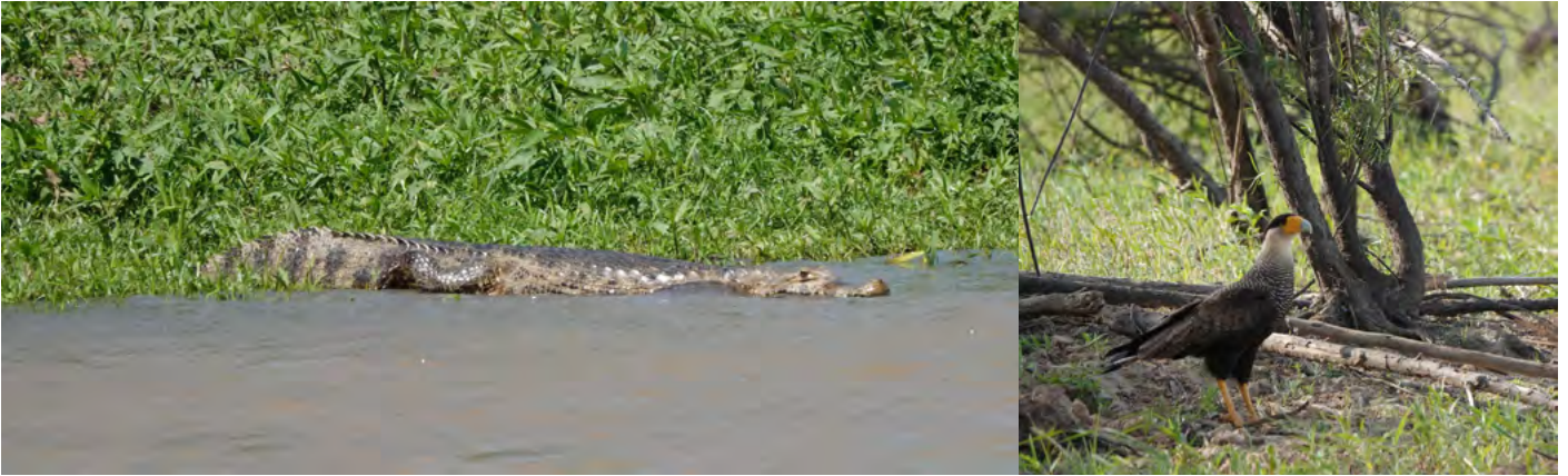
Je bent echt in de wildernis.