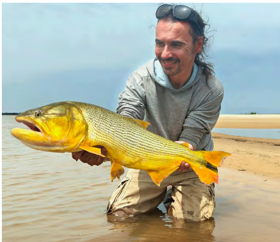
De auteur met een mooie Golden Dorado van de zandbanken.

“Jagende dorado's vinden het namelijk amusant om woest om zich heen te happen als ze door een school aasvis razen.”