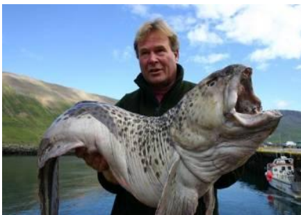
Reusachtige gevlekte zeewolf

De visserij met natuurlijk aas op zeewolf in dieptes van 15 tot 25 meter en het medium pilkeren / jiggen op kabeljauw in dieptes van 15 tot 30 meter zijn veelbelovend en levert gegarandeerd vis op. Het driftend vissen en jiggen met zware shads en het vissen met groot natuurlijk aas in dieptes van 20 tot 50 meter heeft in de afgelopen seizoenen de grootste vissen opgeleverd.