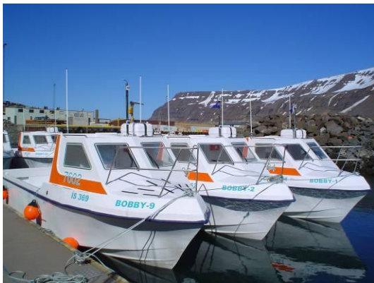
Top boten van de 8 meter klasse !