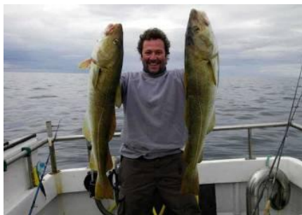
Typische IJsland kabeljauwen