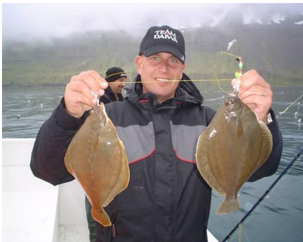
Voorbeeld van prachtige platvissen

In de maanden juli tot en met september worden er ook regelmatig zeeduivels gevangen. Ook deze vissen werden relatief kort onder de kust gevangen. Het merendeel zelfs in de Örnudarfjördurs.