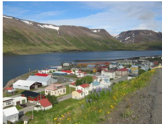
Het vissersdorp Sudureyri in de zomer

Op de GPS apparatuur worden helaas nog wel eens door "minder ervaren" gasten de voorgeprogrammeerde waypoints gewist. Laat svp de basisinstelling zoals hij is en sla alleen nieuwe eigen stekken op als waypoint.