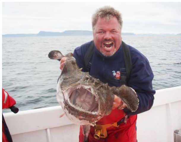
Zeeduivel van 38 pond en een blij visser!

De grote fjord waar Flateyri midden in ligt heeft een gemiddelde diepte van 20 meter. Ook hier kan van de bootsteiger of havenpier op platvis gevist worden. Dit biedt een leuke afwisseling na een lange dag "zwaar" vissen op zee.