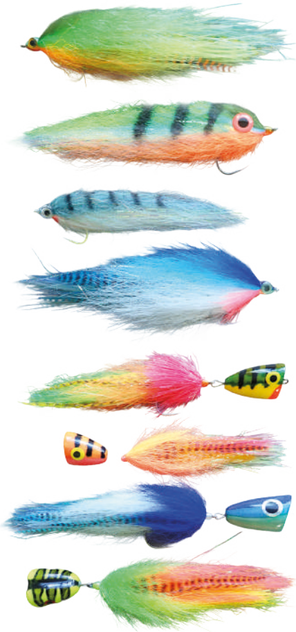
Streamers en poppers voor de peacock