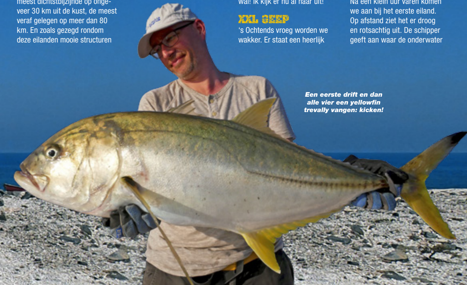
Een eerste drift en dan alle vier een yellowfin trevally vangen: kicken!