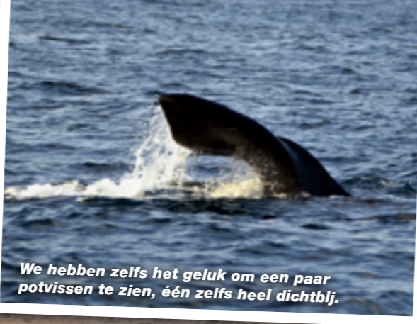
We hebben zelfs het geluk om een paar potvissen te zien, één zelfs heel dichtbij.

De positie ten opzichte van de drop off was een cruciaal element voor de vangsten!