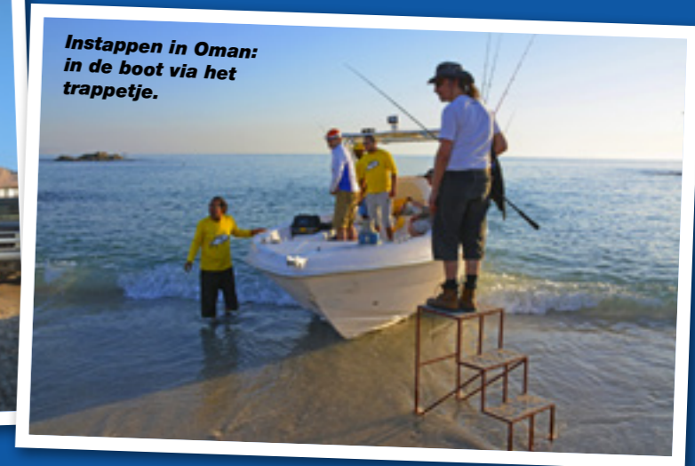
Instappen in Oman: in de boot via het trappetje.

toe! Om succesvol te zijn is een gedegen plan van aanpak van belang. Over mijn aanpak van nieuw water heb ik een artikel geschreven in Rovers december 2017. Die aanpak is zelfs op een heel groot water als de Indische oceaan van toepassing.