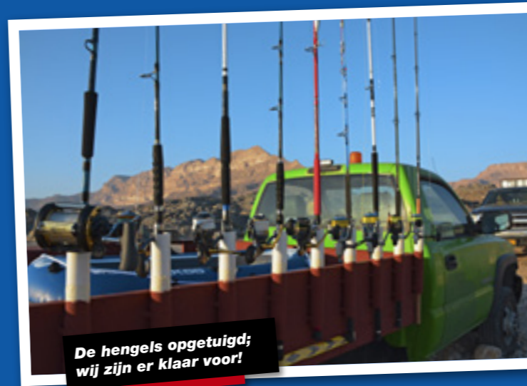
De hengels opgetuigd; wij zijn er klaar voor!

is precies de overgangsmoed van de koudere winterperiode met 'maar' 20 graden, naar de hete zomer met temperaturen van meer dan 40 graden! De zeewatertemperatuur wordt daar natuurlijk ook door beïnvloed en deze wisseling in het voorjaar maakt dat de vis gaat bewegen. Wij hebben ons dus voorbereid op diverse technieken waarbij we ons vooral willen richten op het vangen van Giant Trevally met de popper en het vangen van de andere soorten middels speedjiggen. De GT's in dit gebied staan er om bekend nogal kolossaal te kunnen worden, tot over de 60 kg aan