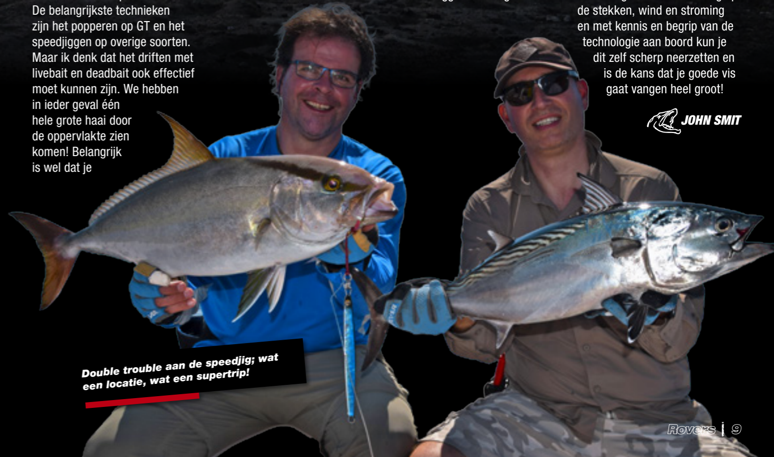
Double trouble aan de speedjig; wat een locatie, wat een supertrip!