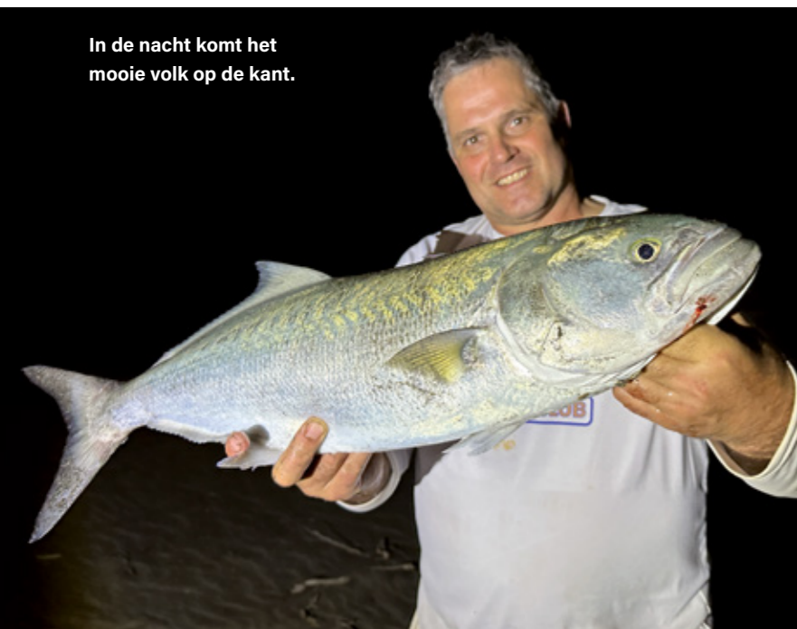
In de nacht komt het mooie volk op de kant.