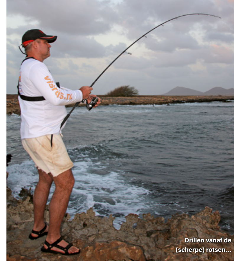
Drillen vanaf de (scherpe) rotsen...