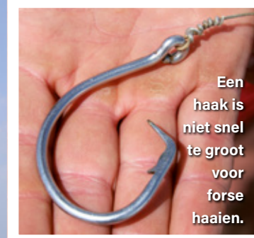
Een haak is niet snel te groot voor forse haaien.