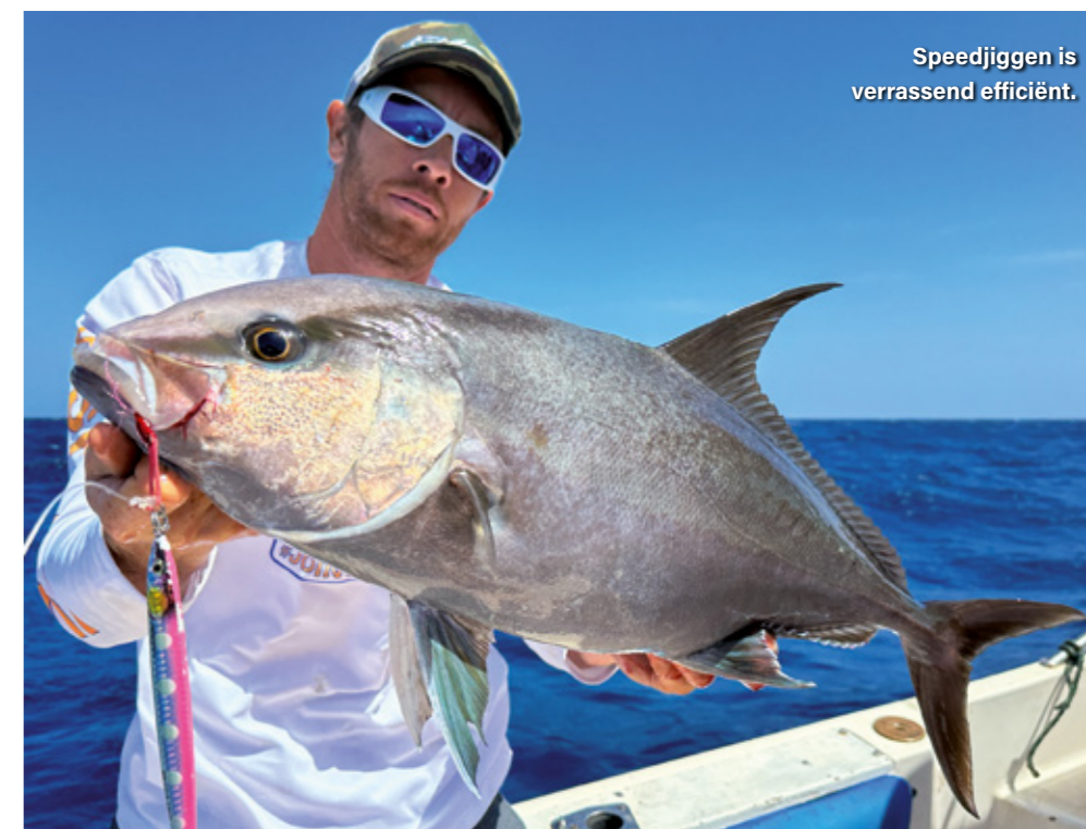
Speedjiggen is verrassend efficiënt.