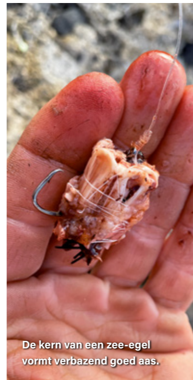
De kern van een zee-egel vormt verbazend goed aas.

verder uit de kust blijken te zitten. Die komen in maart, wanneer het water warmer wordt, weer dicht onder de kant. Meerdere haaien in een tij zijn dan meer regel dan uitzondering.