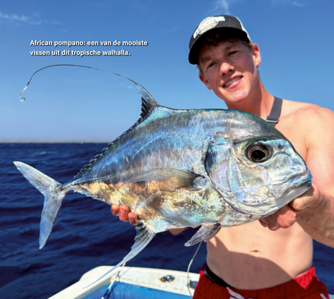
African pompano: een van de mooiste vissen uit dit tropische walhalla.