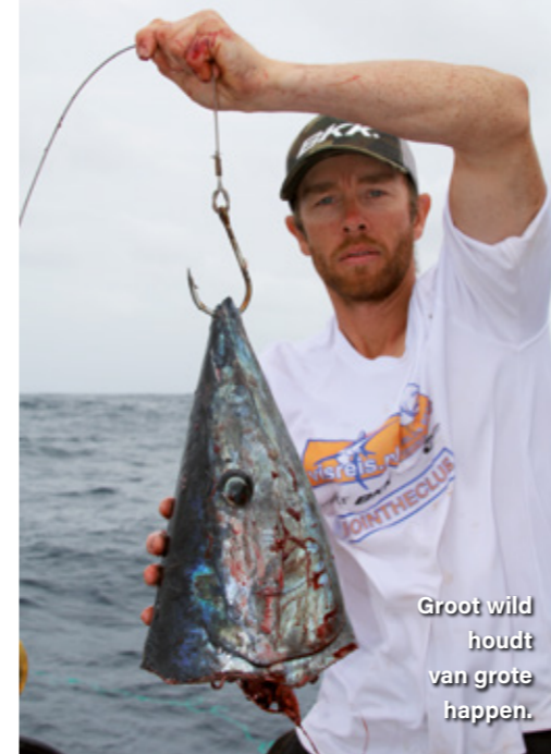
Groot wild houdt van grote happen.