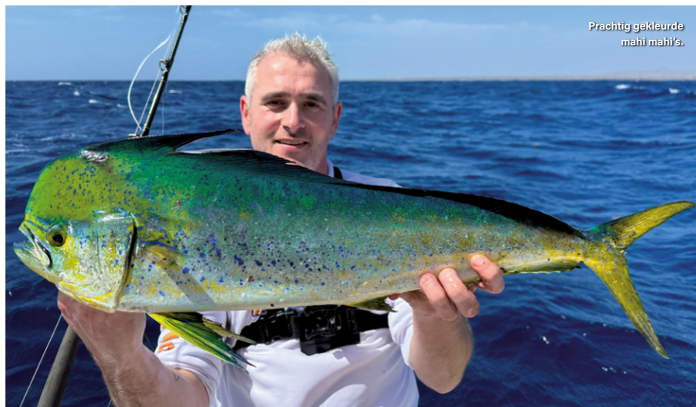
Prachtig gekleurde mahi mahi's.