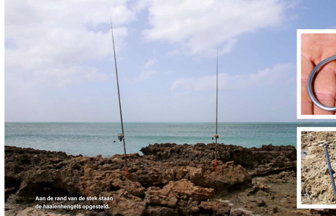
Aan de rand van de steek staan de haaihengels opgesteld.

ons aller droom? Om zo iets te vinden moet je vaak extreem veel geld neertellen en slopende lange vliegereizen verduren – maar met Maio is dat niet het geval. En het mooiste van alles: de