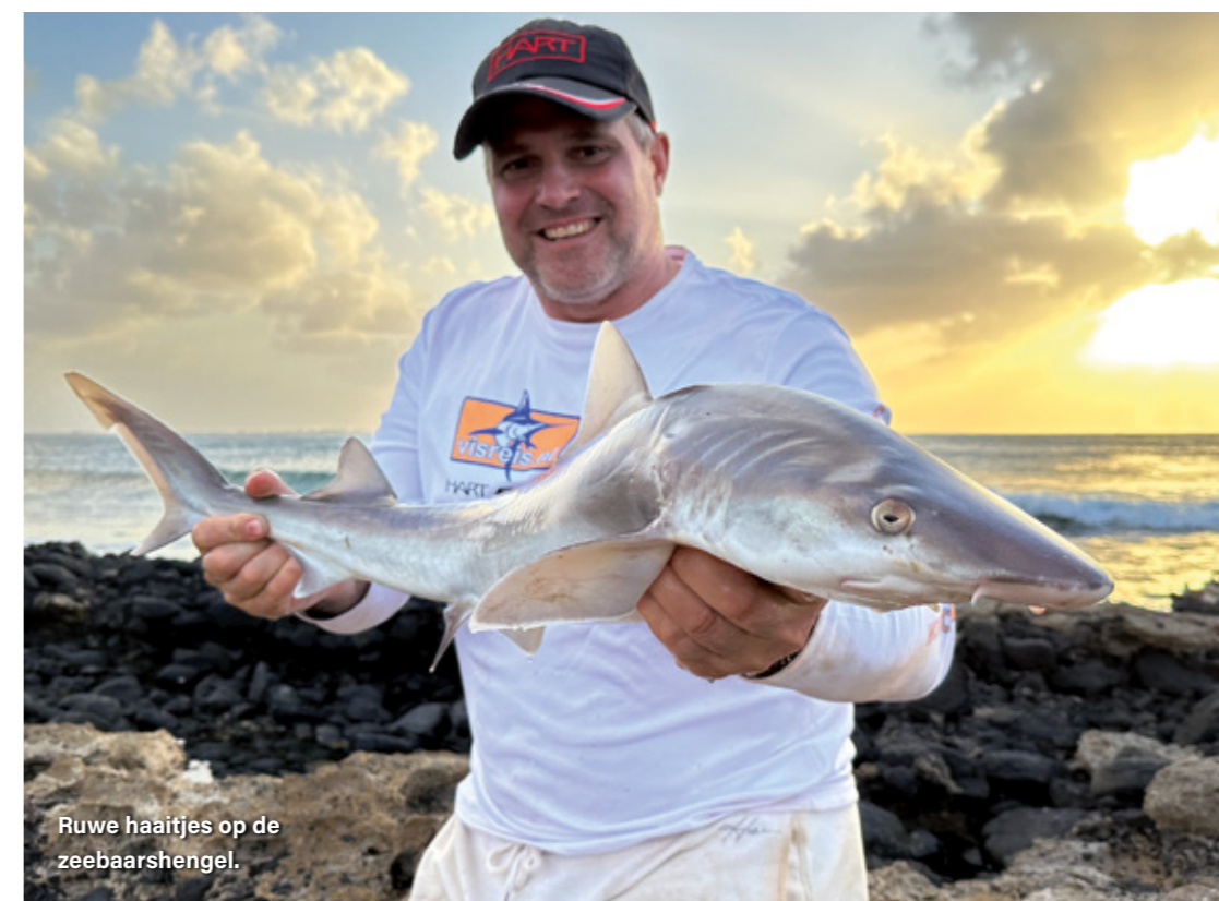
Ruwe haaitjes op de zeebaarshengel.