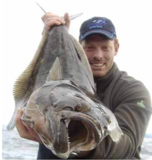
Ondanks hun extreme moordlustige uiterlijk zijn deze superplatten soms geniepig voorzichtig!

gerust een klein aas gebruiken voor de voorzichtige heilbotten. Niet zelden worden namelijk juist de grote, sluwe heilbotten op een klein aasje gevangen. Zo wist een Engelsman diezelfde week een heilbot van 135cm te vangen aan een klein shadje van nog geen 10 cm. Zorg er dan wel voor dat dergelijk klein kunstaas is voorzien van een (extra) stevige haak. Ik had mijn shads voorzien van een zogenoemde assisthook van een speedpilker. Het kevlar lusje van die assisthook leg je om de haak van de shad. Daarna zet je de haak even met bindelastiek vast op de staart. Dit belemmert de actie van de shad niet