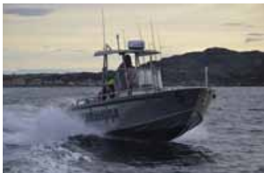
Vissen op heilbot is een fantastische ervaring, die je niet snel vergeet!