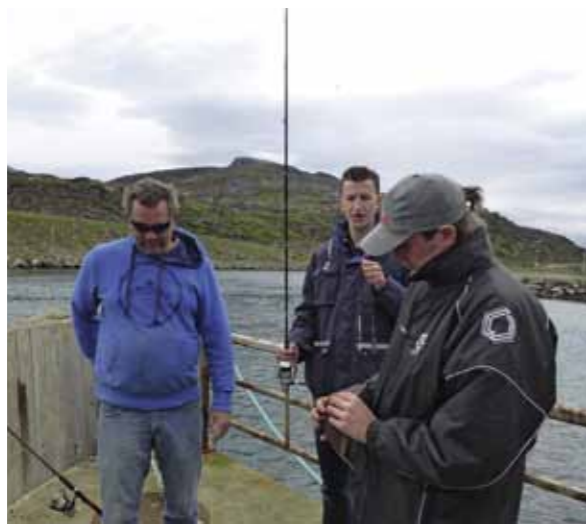
Het advies van de plaatselijke visgids was zelfs om maar naar de kroeg te gaan... Het werd echter kantvissen en lekker vis eten.